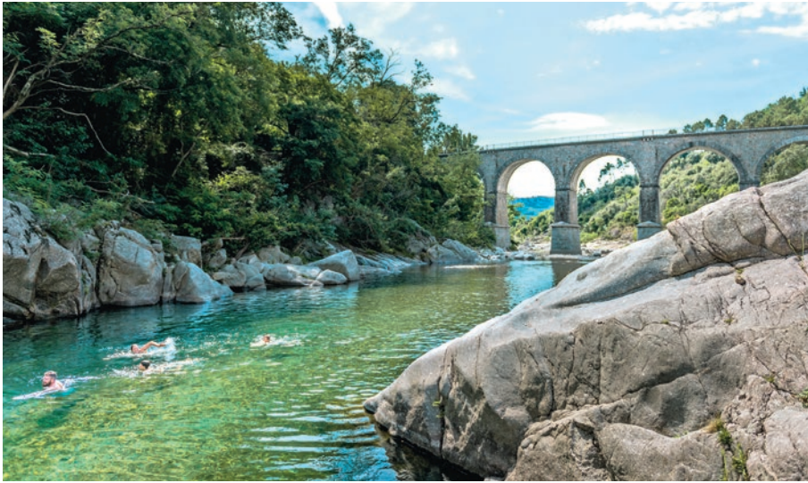
Malgré une saison estivale en demi-teinte, les principaux sites touristiques du territoire ont enregistré une belle fréquentation.

L'année 2025 n'aura pas été simple. C'est en tout cas ce que les opérateurs touristiques du territoire et les élus d'Alès Agglomération retiennent à l'occasion du bilan de la saison touristique qui s'est tenu le 26 novembre 2025 dans la salle du Capitole, à Alès. À cette occasion, plus d'une centaine de prestataires touristiques s'est réunie pour saisir les grandes tendances de l'année écoulée et se projeter dans l'avenir. « Je ne vous apprend rien, le pouvoir d'achat des Français a été durement impacté cette année, a entamé Christophe Rivenq, président d'Alès Agglomération, face à l'assemblée. L'enjeu est donc de continuer à développer le tourisme "nature", authentique et durable, que nous prônons depuis longtemps ».