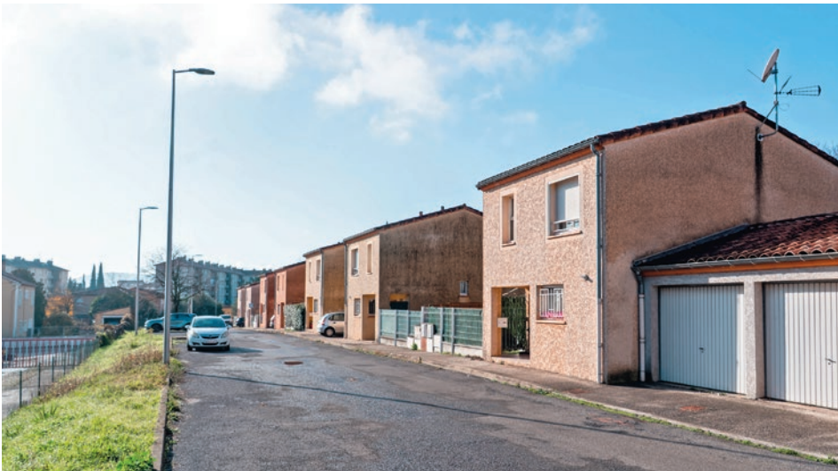
Situées dans le quartier de Tamaris, 33 villas sont actuellement proposées à la vente par Logis Cévenols.