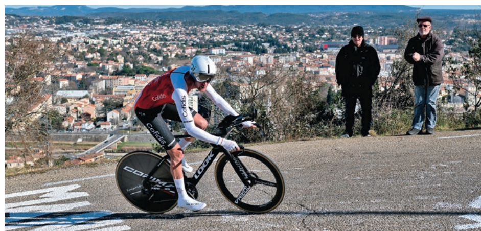
Les pentes de l'Ermitage, à Alès, le traditionnel juge de paix de l'épreuve.

Le Martinet, avec notamment trois ascensions du col des Brousses (2 e catégorie) et deux passages au col de Trélis (1 re catégorie) ! Samedi 7 février, la 4 e étape (157 km) s'élancera de Saint-Christol-lez-Alès pour rejoindre Vauvert, en faisant préalablement deux petites boucles par Ribaute-les-Tavernes, Massillargues-Atuech, Anduze (ascension de la côte d'Anduze, 3 e catégorie), Bagard, puis Saint-Christol-lez-Alès. Idéal pour voir passer les coureurs plusieurs fois en variant les points de vue. Enfin, dimanche 8 février sera consacré au traditionnel contre-la-montre individuel (10 km) qui se dispute à Alès et avec un