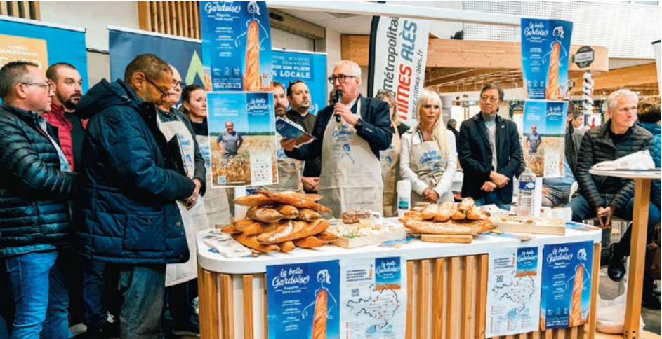
La Belle Gardoise est déjà en vente dans 8 boulangeries sur le territoire d'Alès Agglomération.

15 AGRICULTEURS ET 26 BOULANGERIES PILOTES