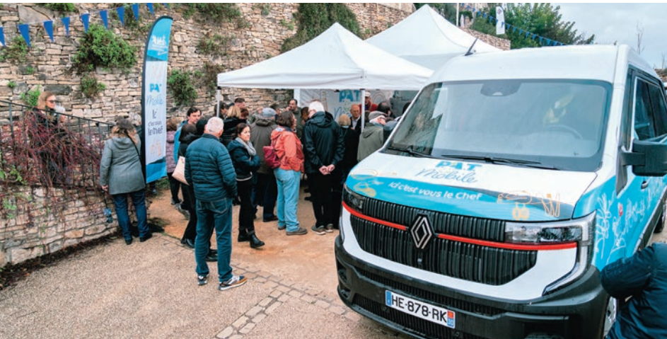
La PAT'Mobile a été présentée au public le 30 novembre 2025 à Vézénobres comme un véhicule conçu pour réinventer le quotidien culinaire des habitants d'Alès Agglomération.