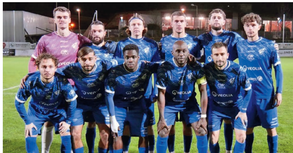
Longtemps solides leaders du championnat de National 3, les footballeurs alésiens ont réalisé une première moitié de saison quasi sans faute.

française de football (FFF), saisie par les clubs adverses à l'issue des rencontres du début de saison contre l'Olympique de Marseille II et Lyon-la-Duchère, a estimé que l'OAC avait aligné trop de joueurs mutés sur ces deux matchs par rapport à ce qu'autorise le règlement. Dans un communiqué officiel, le club a indiqué avoir pris acte de la décision de la Commission Supérieure d'Appel de la FFF, qui confirme le retrait de 8 points au classement... Cette sanction combine la perte de 6 points correspondant à deux matchs perdus sur "tapis vert" (gagnés sportivement), ainsi que 1 point de pénalité supplémentaire par match. Il va sans dire que cette décision constitue un coup dur pour le club cévenol. « La frustration est immense ! », partagent les