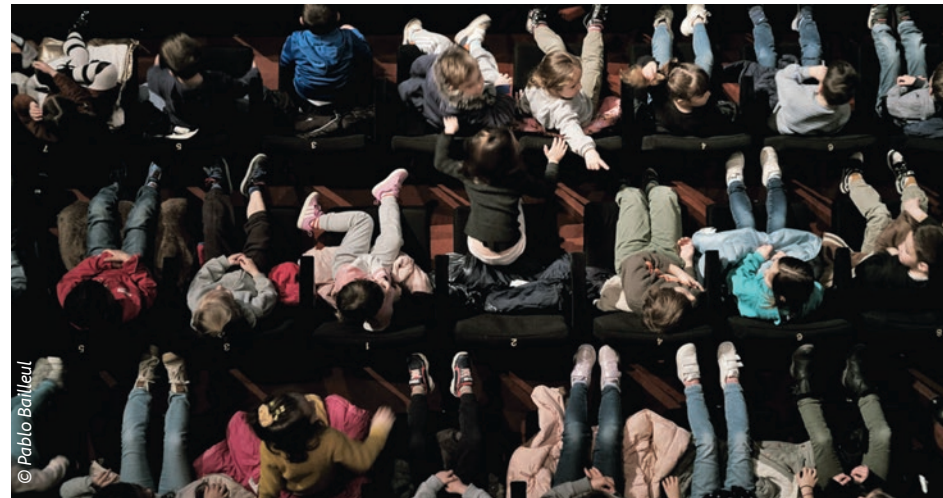
L’éducation à l’image crée une ouverture sur le monde pour le jeune public.

PRÈS DE 20 % DES ÉCOLIERS GARDOIS CONCERNÉS