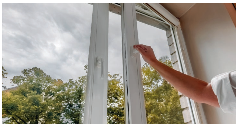
Aérer son logement tous les jours pendant 10 minutes est un geste simple qui permet d'assainir son intérieur et de diminuer l'humidité retenue.

pétrole) : ces entretiens annuels concernent à la fois les chaudières, les poêles, les chauffages d'appoint et même certaines cuisinières. Évitez aussi d'utiliser des barbecues, des braseros ou des groupes électrogènes dans des espaces confinés. Évitez également de laisser tourner le moteur de votre voiture dans un garage fermé. Enfin, pour les personnes se chauffant grâce à une cheminée ou à un poêle, il est primordial de procéder au ramonage des conduits pour éviter les risques d'incendie et assurer un bon tirage de l'air.