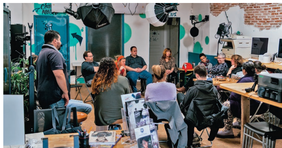
En plus de permettre le développement de photographies argentiques, l’enregistrement de bandes son ou d’imprimer des objets en 3D, le Focus organise des ateliers et des tables-rondes, comme ici avec France Travail.

photos, leurs dessins de presse, ... ». Le prochain numéro portera notamment sur les métiers de la santé et de la sécurité, avec des immersions auprès des soignants de l’hôpital d’Alès, des gendarmes, de l’armée, des pompiers, ... Ouvert depuis le 11 octobre 2025, le Focus accueille donc les jeunes inscrits dans ce dispositif, mais également les publics participants aux “Critiques pétillantes” : « Nous permettons à un public atteint de handicap de découvrir des spectacles, des expositions, des concerts, et d’en faire librement la critique après avoir interrogé les artistes ». Sans oublier le projet “Culture et Gastronomie”, permettant