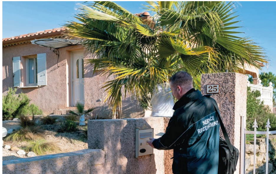
Soumis au secret professionnel, les agents recenseurs sont là pour vous aider dans vos démarches qui, rappelons-le, sont obligatoires.

La mécanique diffère pour les communes de moins de 10 000 habitants, soit les 70 autres communes de l'Agglo, qui sont entièrement recensées, mais une fois tous les cinq ans. Dix d'entre elles sont inscrites au recensement 2026, du 15 janvier au 14 février : Cendras, Lamelouze, Les Plans, Ribaute-les-Tavernes, Rousson, Saint-Hilaire-de-Brethmas, Saint-Jean-de-Valérisclle, Saint-Just-et-Vacquières, Servas et Soustelle. Début janvier, les habitants concernés recevront un courrier de l'INSEE. Puis les agents recenseurs effectueront des visites à domicile munis de leur carte officielle, tricolore, avec