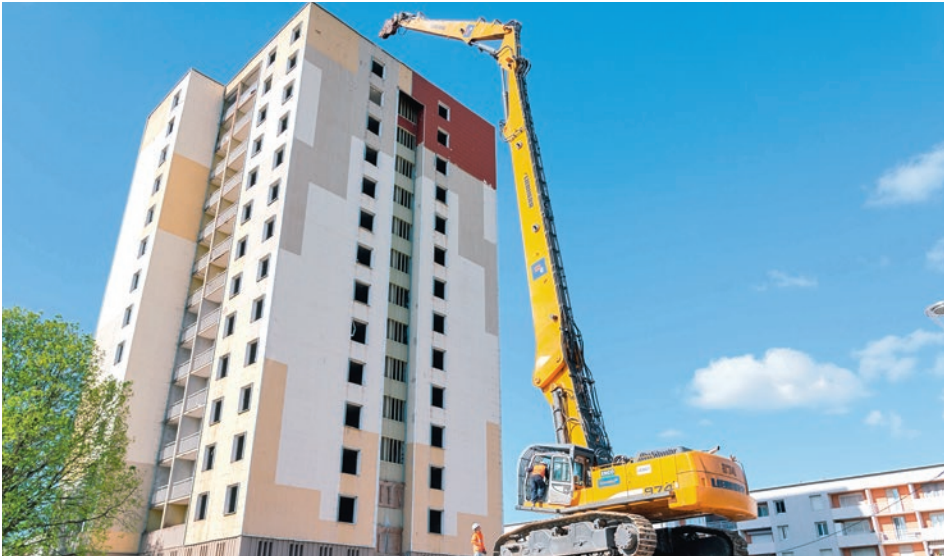
Les opérations menées dans le cadre du NPNRU représentent, cette année encore, plus de la moitié du budget total d'investissement de Logis Cévenols.