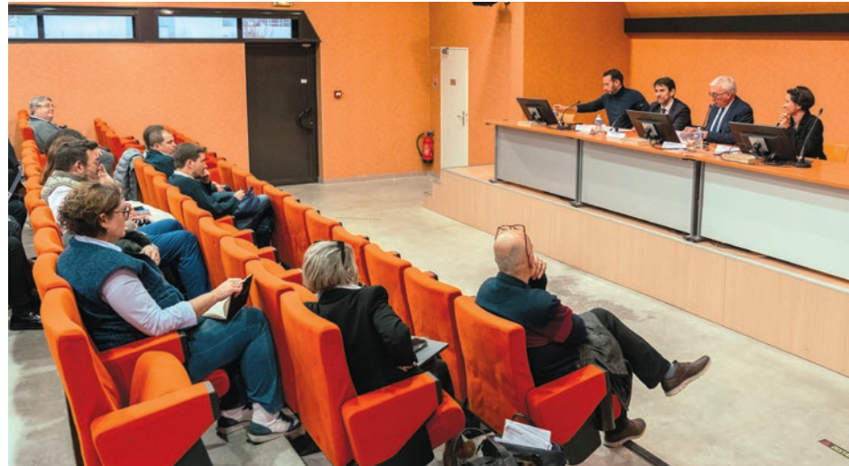
Réunis à Alès le 2 décembre, des dirigeants d'Alès Agglomération et de l'Université de Nîmes ont présenté l'arrivée du diplôme universitaire PaRéO, un tremplin post-bac destiné à faciliter la transition lycée-université.

L'objectif est donc clair : raccrocher ceux qui veulent continuer, mais qui ne le peuvent pas. Une mission pour laquelle Alès Agglomération s'investit, notamment à travers la création d'un Conseil de l'enseignement supérieur ou la récente signature d'une Cité Éducative à l'échelle de l'Agglomération, pour la première fois en France (Alès Agglo n° 138 – Décembre 2025, p.3). À quelques jours de l'ouverture de la plateforme Parcoursup (début des inscriptions et de la formulation des vœux le 19 janvier), la mise en place du dispositif PaRéO répond à une problématique non négligeable sur le territoire : près d'un jeune sur deux ne poursuit pas d'études post-bac, pour diverses raisons (transports, logements,