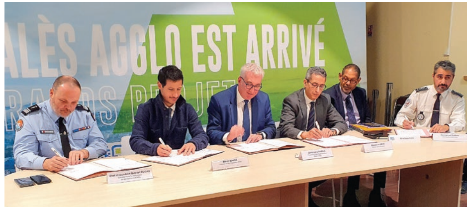
(De g. à d.) Commandant de gendarmerie, président du tribunal d'Alès, président d'Alès Agglomération, procureur de la République, sous-préfet et commissaire de police ont réaffirmé leur engagement pour une approche collective et rationnelle des enjeux sécuritaires sur le territoire.

clair : « Il y a des difficultés qu'il ne faut pas nier, mais Alès n'est ni Chicago ni Marseille ! », lançant un avertissement contre les analyses catastrophistes et les amalgames médiatiques.