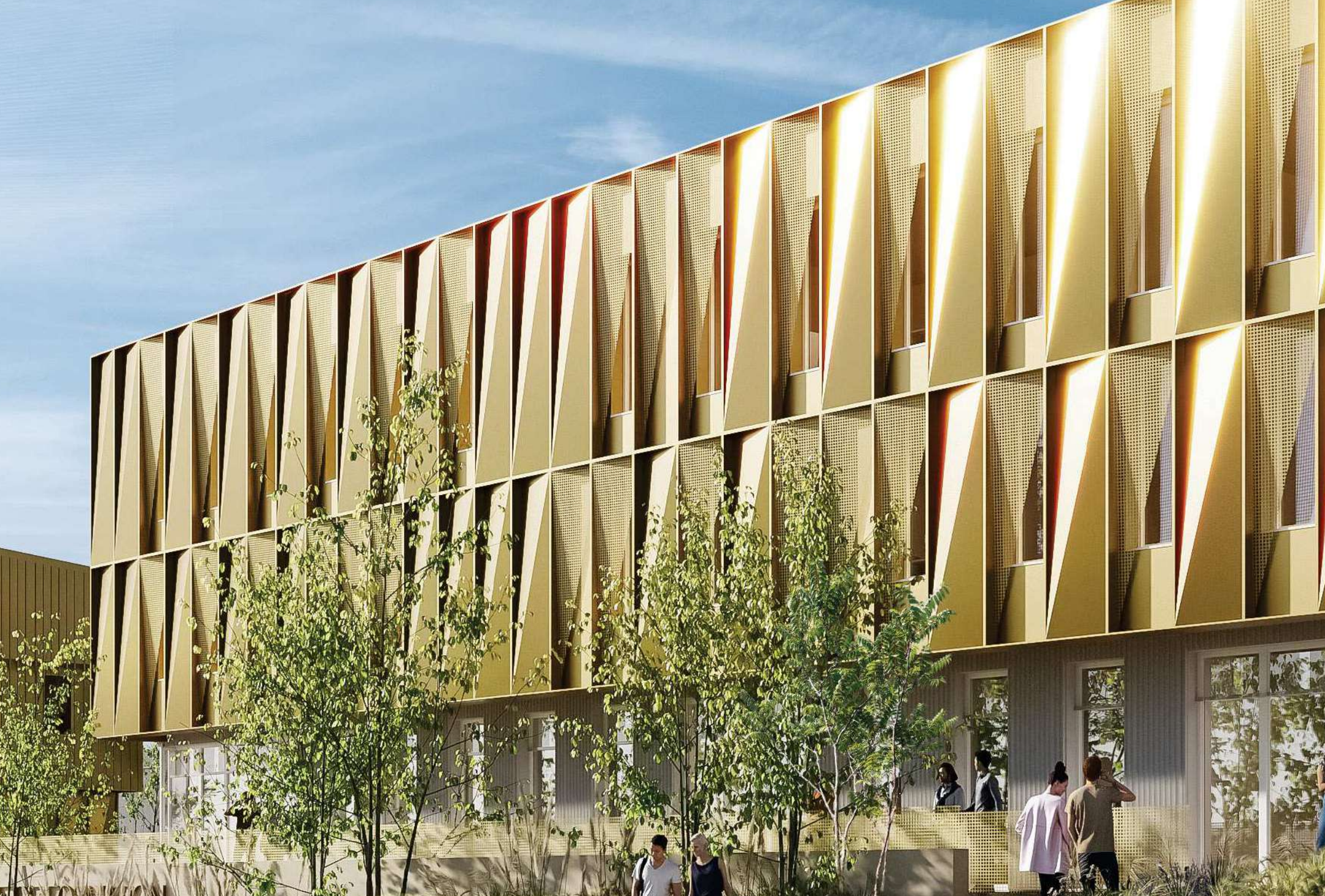
DETAIL FACADE AVENUE JBD