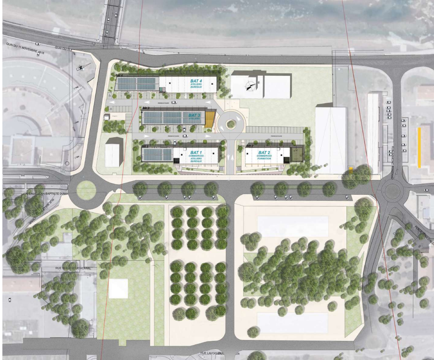
PLAN MASSE A L'EHELLE DU QUARTIER - Echelle 1/1000°