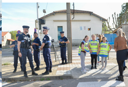
Les jeunes du Conseil Municipal