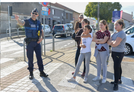
Les jeunes du Conseil Municipal