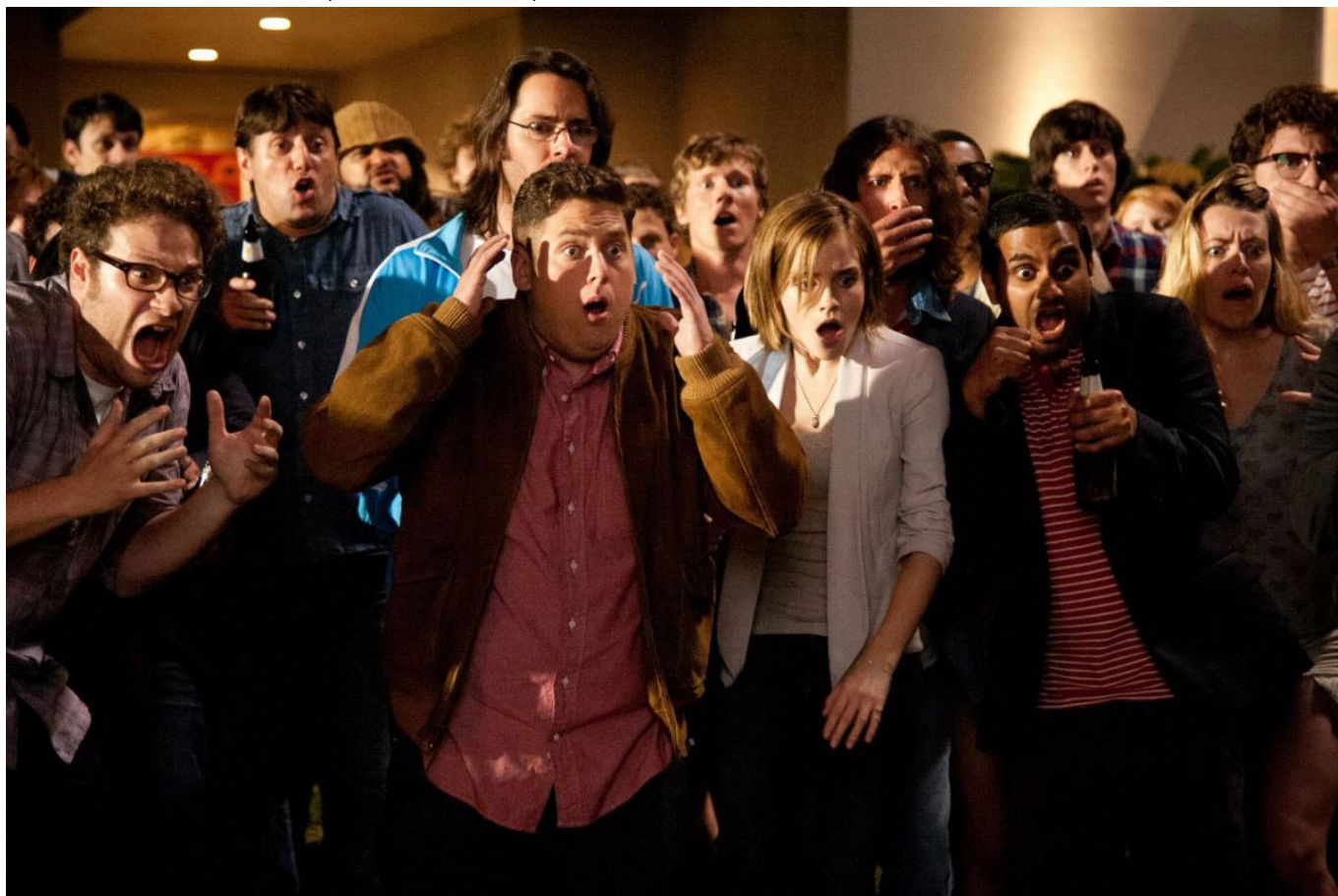
C'est la fin