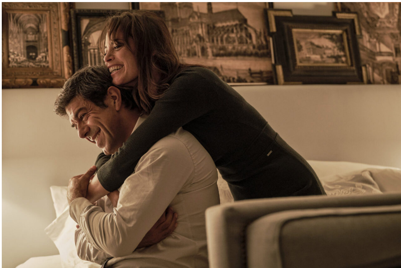
Le colibri