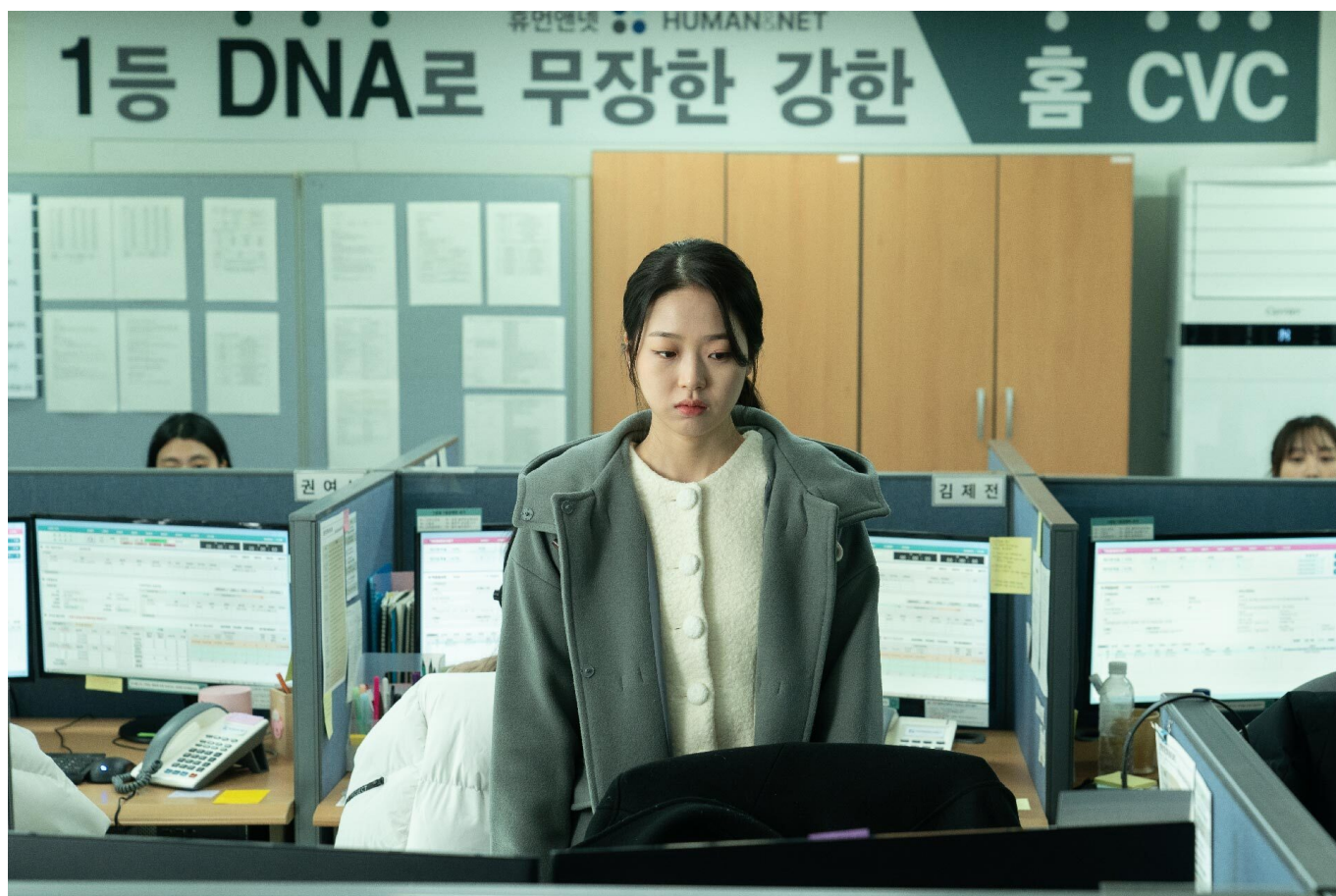
ABOUT KIM SOHEE