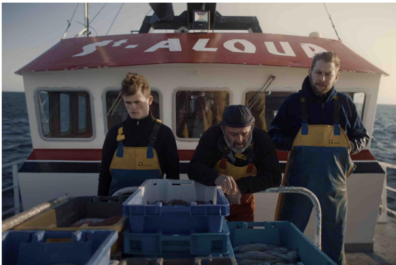
Les silencieux est l'un des 11 courts-métrages en lice pour la compétition 2023.