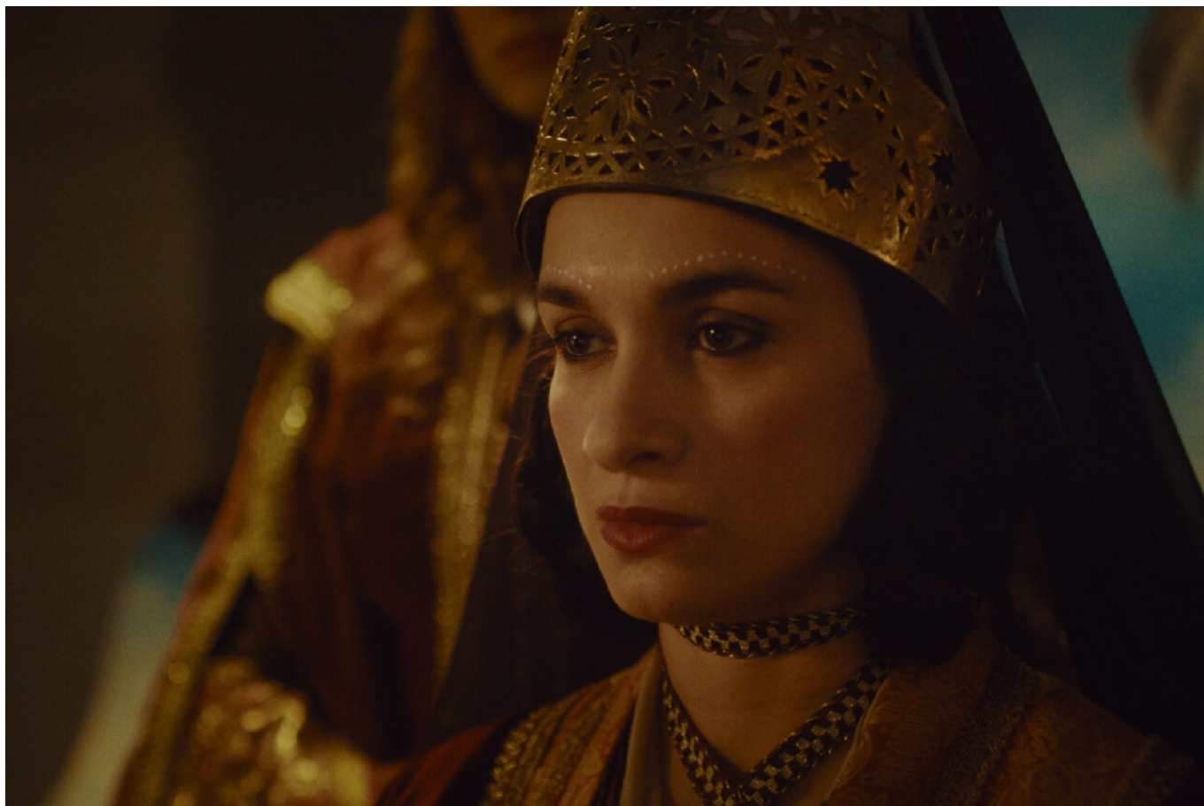
La dernière reine