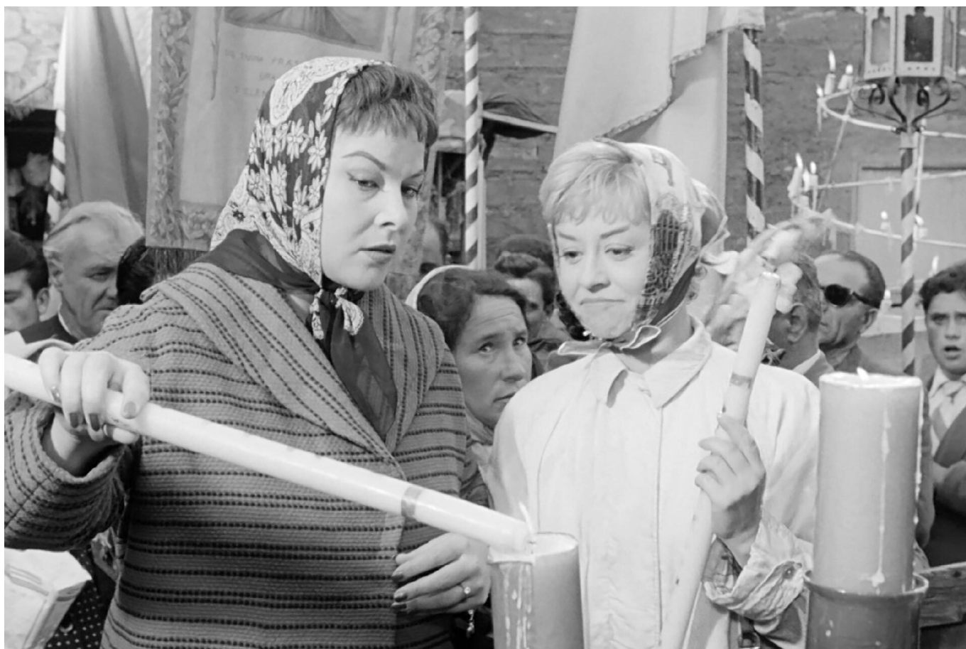
Les nuits de Cabiria © Festival Cinéma d'Alès – Itinérances