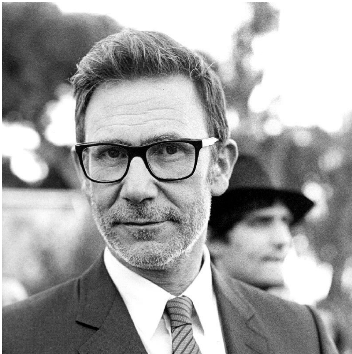
Michel Hazanavicius ©Patrice Terraz

Le célèbre réalisateur français, reconnu mondialement pour ses films comme The Artist , long-métrage aux 160 récompenses dont 5 oscars, ainsi que les deux films parodiques OSS 117 , ou encore dernièrement Coupez ! , comédie mêlant zombies et film dans le film qui a fait l'ouverture du Festival de Cannes en 2022, sera présent du samedi 25 au mardi 28 mars. À cette occasion, une nuit rythmée par quelques-uns de ses films et de nombreuses surprises est proposée au public le samedi 25 mars, dès 22h45 au Cratère. Il tiendra également une masterclass le dimanche 26 mars à 16h15, au Cratère (entrée gratuite).