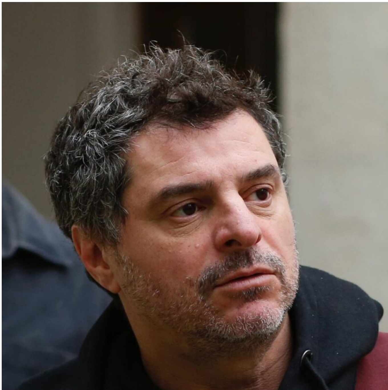
Pierre Salvadori