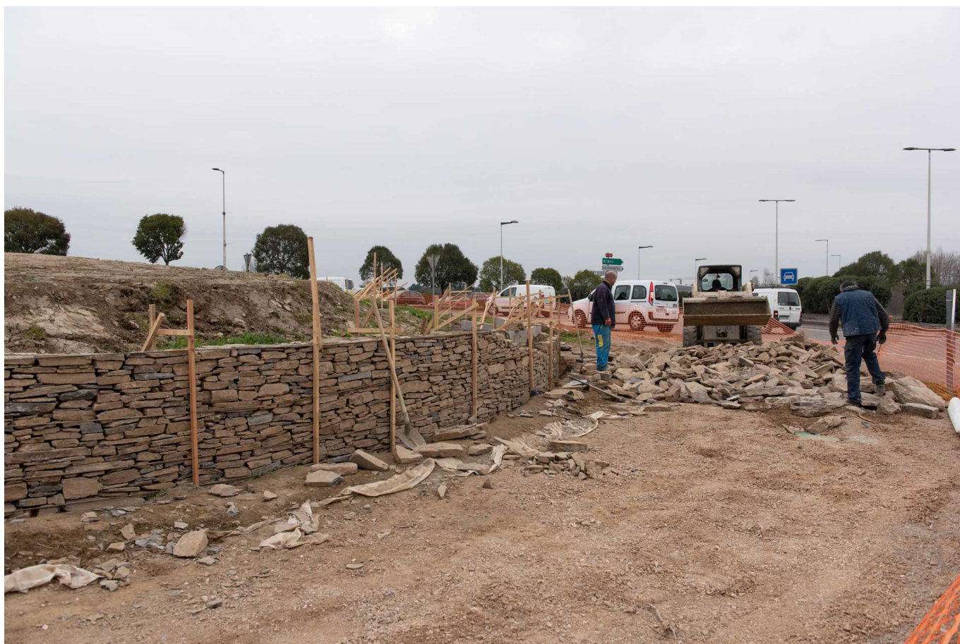
Le rond point de la 2×2 voie est en cours de reconstruction autour du thème des Cévennes.