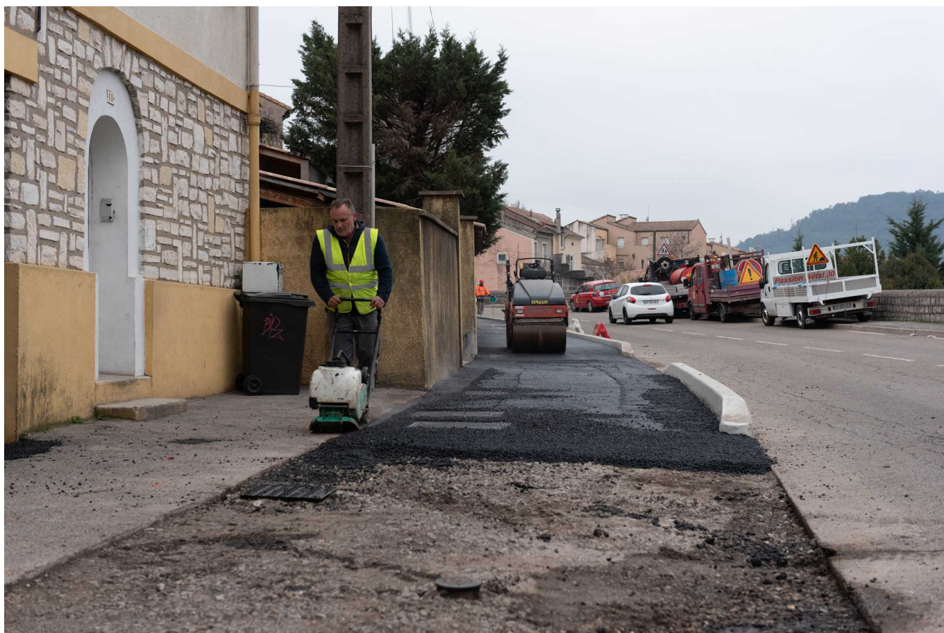
Avenue d'Alsace, une voie cyclable est en cours de construction.