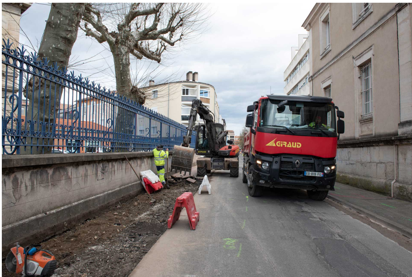
États généraux du cœur de ville : de nouveaux espaces partagés sont en cours de création dans les rues Michelet et Baronnie.