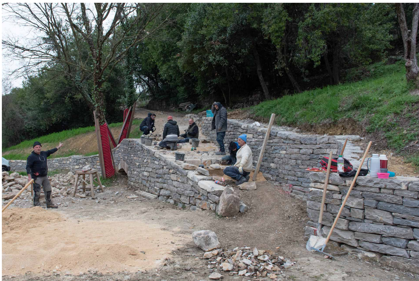
Parc de Conilhères : l'aménagement du parc se poursuit avec la construction des murets et calades au sud.