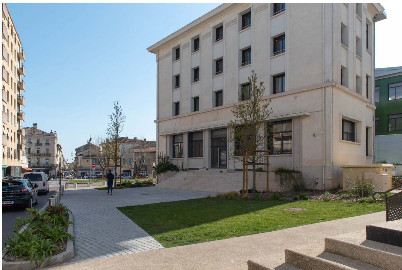
En 2021, l'ancien bâtiment de France Telecom deviendra la Maison de l'économie d'Alès Agglomération.